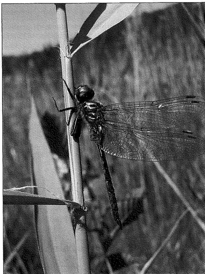
Somatochlora flavomaculata , le 7 juillet 2007

En prévision de la prochaine parution de l'atlas des Odonates de Rhône-Alpes (Groupe Sympétrum), environ 150 naturalistes bénévoles se sont mobilisés, notamment entre 2002 et 2007, période durant laquelle le nombre des observations dans la base de données est passée de 10 000 (FATON, 1997a, 1997b, 2003) à 20559. Nous comptabilisons maintenant 67 espèces. 94 % des communes de notre département ont été prospectées au moins une fois. Il reste cependant 3 ou 4 espèces à découvrir dans les étangs du nord du département, car ces espèces sont présentes dans des communes limitrophes en Isère, notamment Leucorrhinia caudalis (Charpentier, 1840).